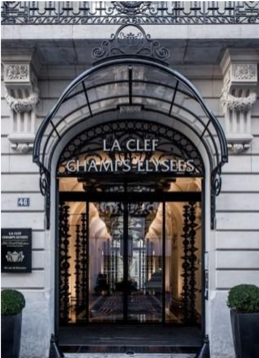
La Clé Champs-Élysées